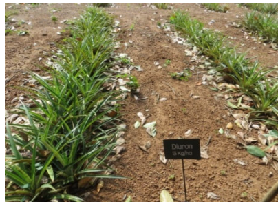
ഡൈയുറോൺ തളിച്ചത് 3 മാസത്തിനു ശേഷം