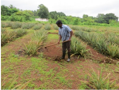
തുവ്വ കൊണ്ട് ചെത്തൽ