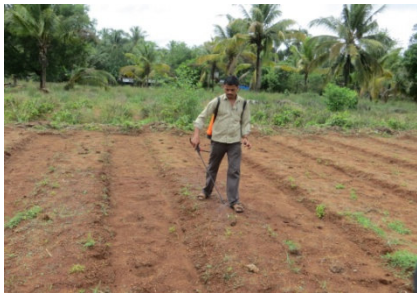
കളകൾ മുളക്കുന്നത് തടയുന്ന കളനാശിനി പ്രയോഗം

കൈതചെടിയിലുള്ള മുളളുകൾ മൂലം കളകൾ പഠിച്ചുമാറ്റുന്നത് ഏറ്റവും ശ്രമകരമാണ്. തൊഴിലാളികളുടെ ദുർലഭ്യവും കൂലി വർദ്ധനവും മൂലം പ്രായോഗിക മാർഗ്ഗം കളനാശിനി ഉപയോഗിക്കുകയാണ്.