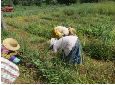
അരിവാൾ കൊണ്ട് വീശൽ