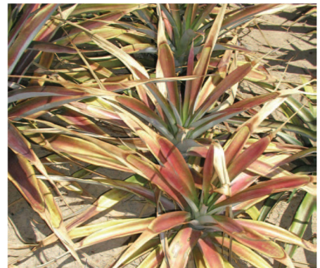
മീലിബ്സ് വിൽറ്റ് അസ്സോസിയേറ്റഡ് വൈറസ് രോഗത്തിന്റെ ലക്ഷണങ്ങൾ