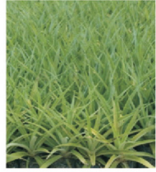
ടിഷ്യൂ കൾച്ചർ തൈകൾ

വിവിധ രീതികളിൽ കാനികൾ നടുമ്പോൾ വരിയിൽ കാനികൾ തമ്മിലും, വരികൾ തമ്മിലും, ഈരണ്ട് വരികൾ തമ്മിലുള്ള അകലവും ഇതിനായി ഒരു ഹെക്ടറിലേക്ക് വേണ്ടകാനികളുടെ എണ്ണവും ഇനി പറയുന്നു.