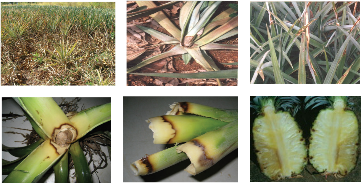
ചീയൽ രോഗത്തിന്റെ ലക്ഷണങ്ങൾ