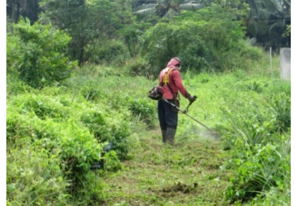
കളകളെ മുറിക്കുന്ന യന്ത്രം