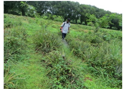
മുളച്ച കളകളെ നശിപ്പിക്കുന്ന കളനാശിനി പ്രയോഗം