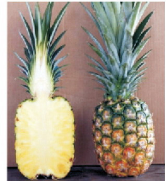
എം.ഡി - 2